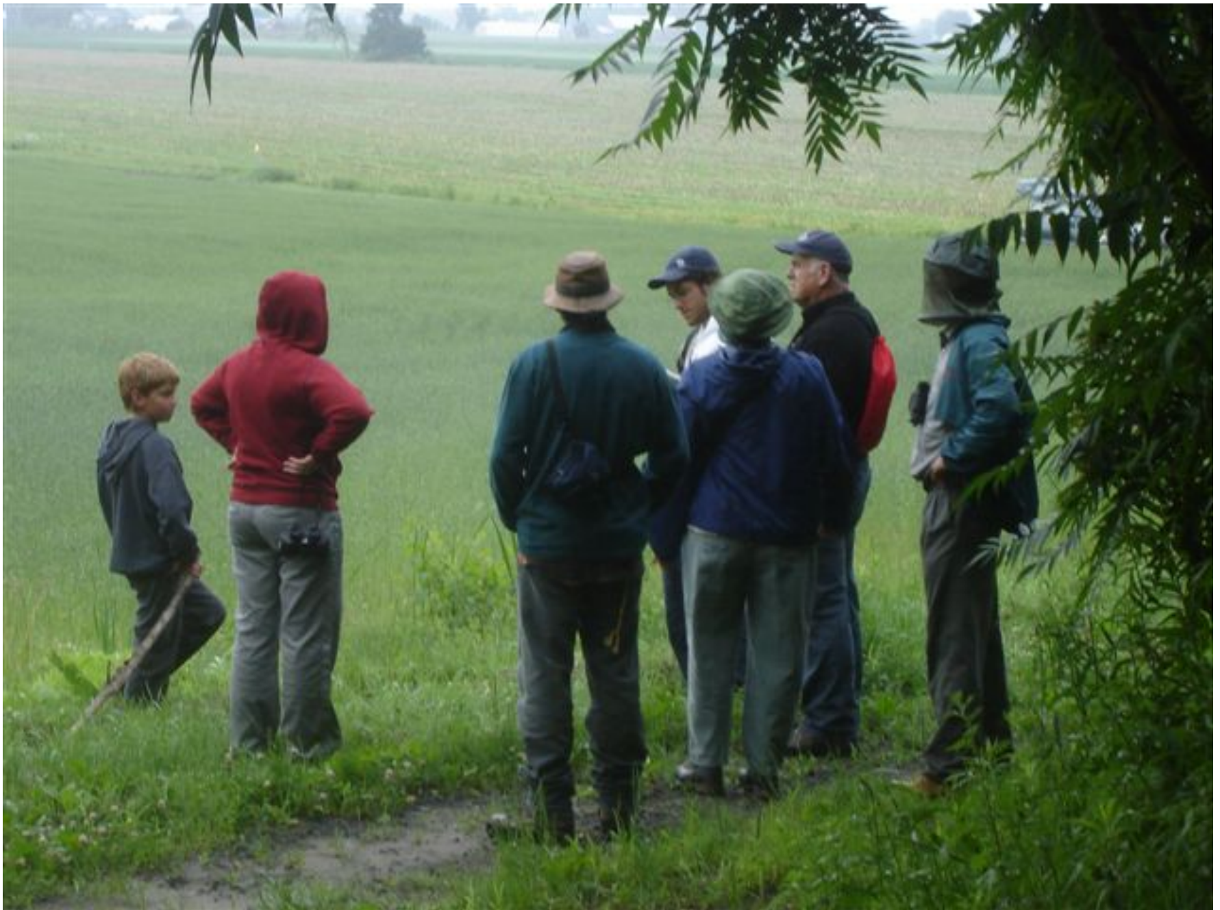
Activité d'observation de la biodiversité, été 2006, Montérégie