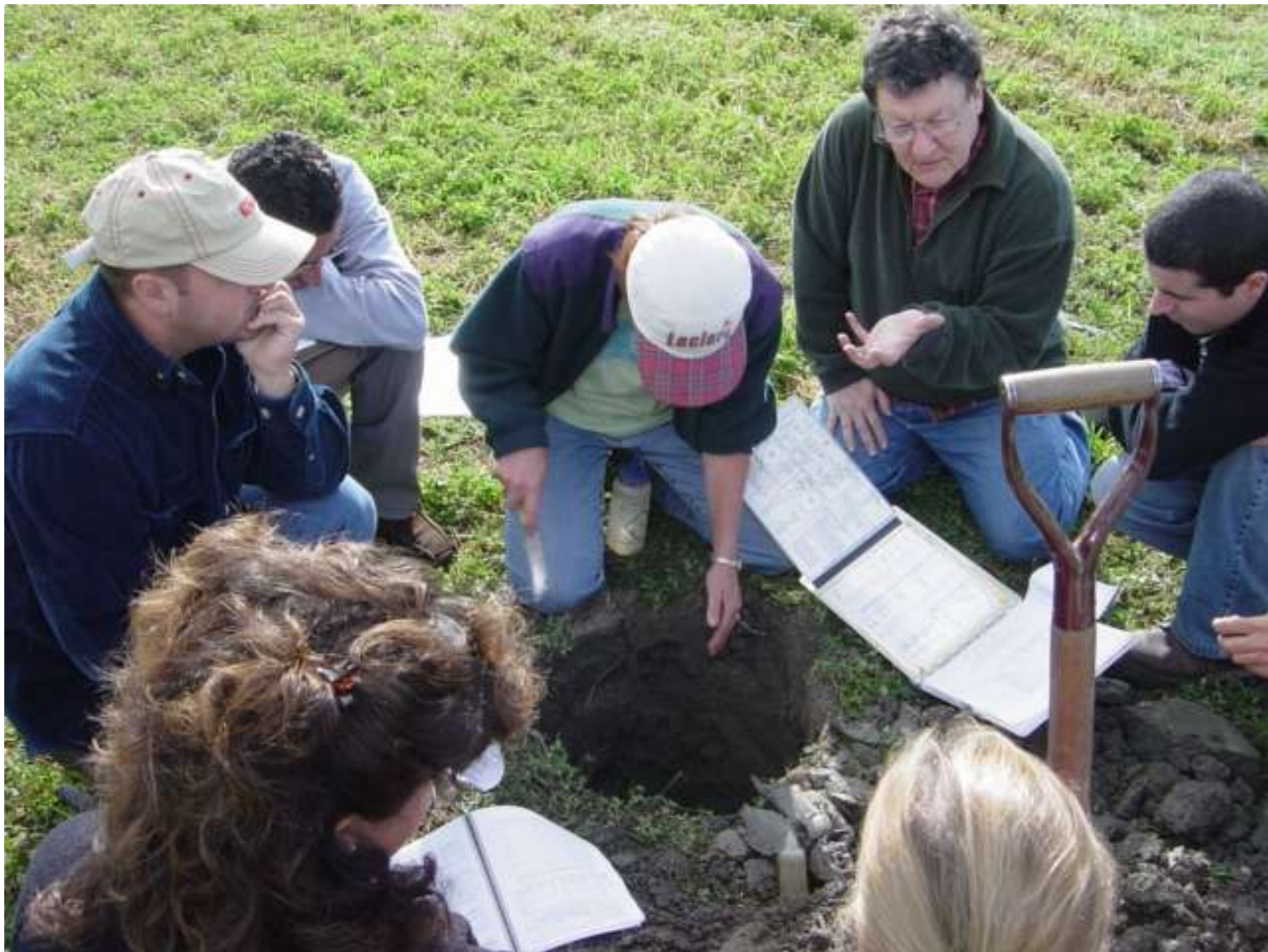
Formation aux éco-conseillers « Profil pédologique », été 2004, Montérégie