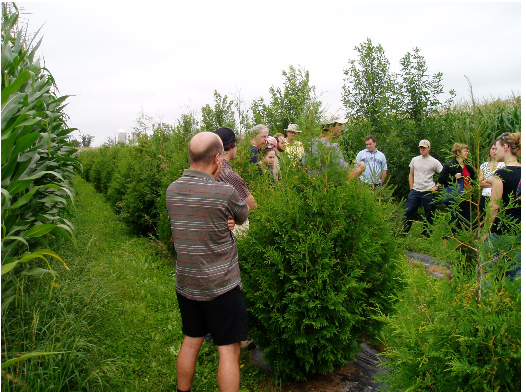
Visite des aménagements du bassin versant du ruisseau des Aulnages, été 2007, Montérégie