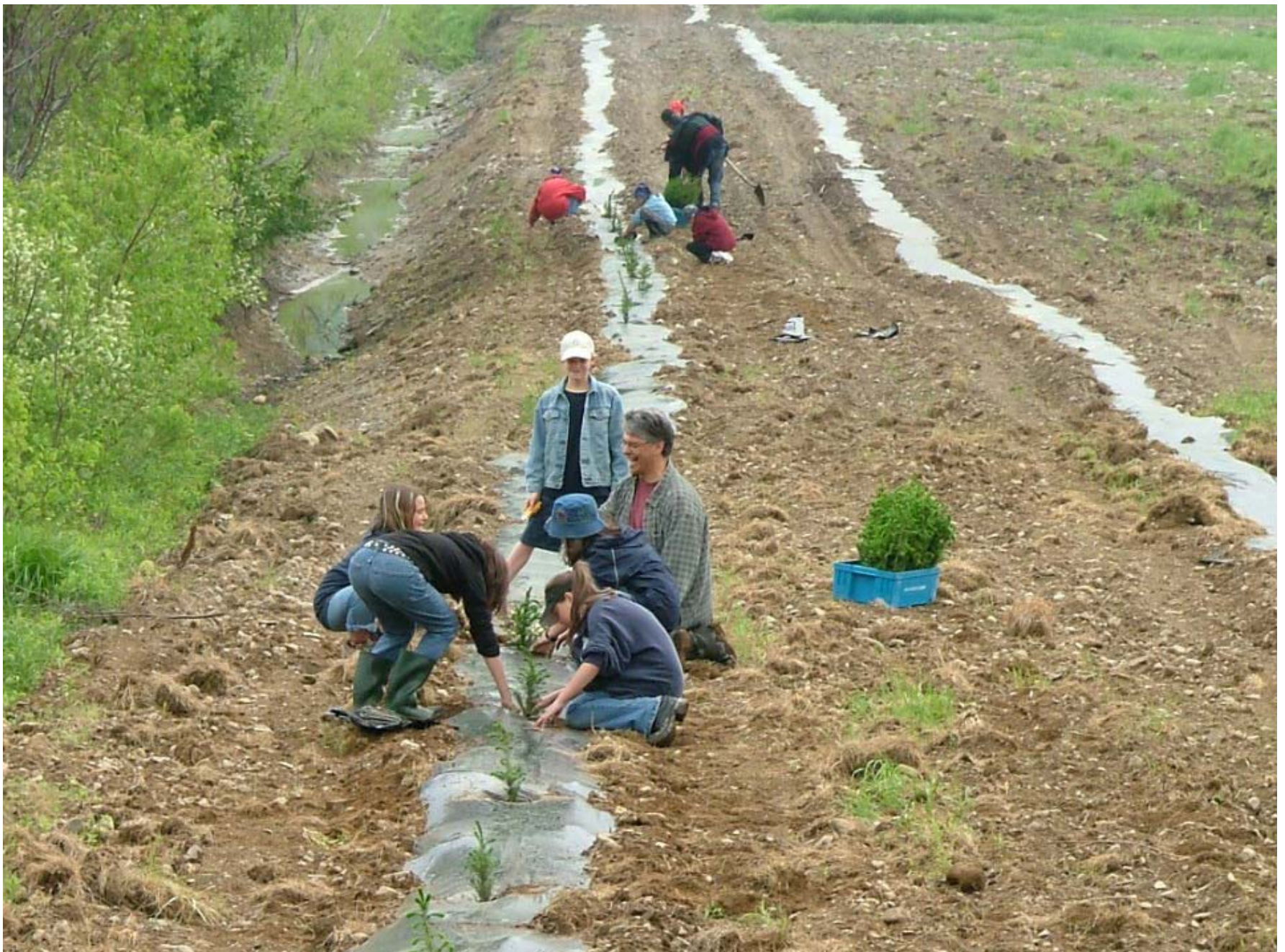
Plantation d'une haie brise-vent avec des élèves du primaire, été 2006, Beauce