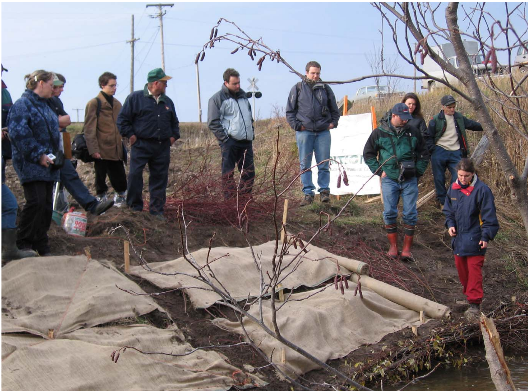
Visite du site d'aménagement de la Rivière Barrure, été 2006, Bas-St-Laurent